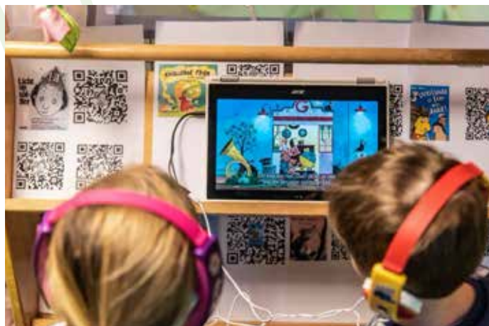
In de HEHA-school in Dendermonde stemt men het lees- én luisteraanbod af op de noden en de interesse van de kinderen. Ook digitaal lezen kan de leesgeesting laten groeien.

Als we de resultaten voor de meer dan 200 leesscans globaal bekijken, stellen we vast dat scholen zichzelf het laagst scoren voor de factoren leesbeleidsplan en leesbevordering. Ook wat betreft leesmonitoring geven de scholen aan dat er duidelijk nog groeikansen zijn. Verder stellen we significante verschillen vast tussen scholen in het basisonderwijs en scholen in het secundair onderwijs wat betreft hun perceptie over hun leesonderwijs. Meer bepaald schatten basisscholen zichzelf sterker in dan secundaire scholen als het gaat om het leesbeleidsplan, het installeren van een motiverende leesomgeving en het werk maken van een brede leesmonitoring op regelmatige basis. Secundaire scholen beoordelen zichzelf dan weer hoger voor wat betreft het hanteren van een effectieve leesdidactiek. Dat er duidelijk nog ruimte is voor groei wat betreft de verschillende componenten, is voor de onderzoekers een pleidooi om ervaringen binnen basis- en secundair onderwijs breed te delen. De ervaringen vanuit succesvolle leesbeleidstrajecten in basis- en secundair onderwijs kunnen inspirerend zijn voor scholen die met een leesbeleid van start willen gaan. In de komende twee jaar zal de leesscan daarom uitgebreid worden met inspirerende praktijkvoorbeelden. Wil je je eigen leesbeleid als school ook kritisch onder de loep nemen? Neem dan alvast eens een kijkje op www.leesscan.be .