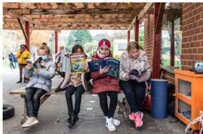
Immaculata Maria, Roosdaal