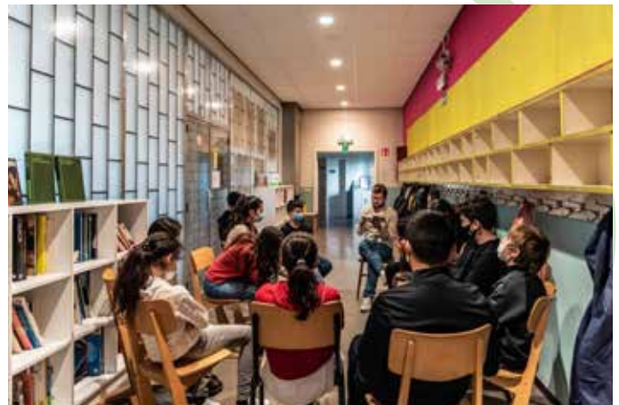
In de Bollekensschool in Gent ontstaan rijke gesprekken over boeken en teksten.