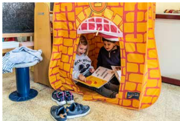
© PRO Lezen / Simon Bequoye / Immaculata Maria, Roosdaal

In de IMI-school in Roosdaal kunnen de kinderen ook buiten gezellig lezen.