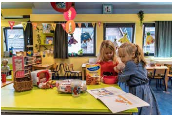
Kleuters worden gestimuleerd tot functioneel lezen in de kookhoek in de HEHA-school in Dendermonde.

Een competente leraar realiseert een effectieve, maar tegelijkertijd ook leesbevorderende leesdidactiek. Een motiverende leesomgeving alleen is immers niet voldoende. Er moet regelmatig tijd gemaakt worden voor boekpromotie en boekverwerking via inspirerende werkvormen als een boekenkring, boekenbabbels, creatief schrijven ... Zo'n klassikale momenten worden bij voorkeur aangevuld met individuele leesgesprekken, waarbij leerlingen ondersteuning krijgen om hun leesvoorkeur te ontdekken met aandacht voor tekstvoorkeur, leesniveau, auteurs, interesses ... Een leesbevorderende leraar stimuleert de leesmotivatie van leerlingen door hun